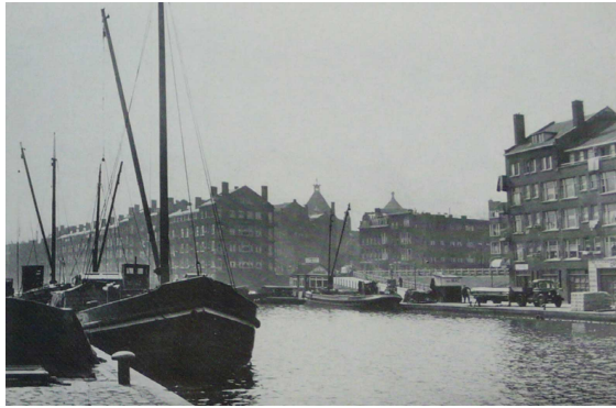
Rond 1950, bron: Gemeentearchief